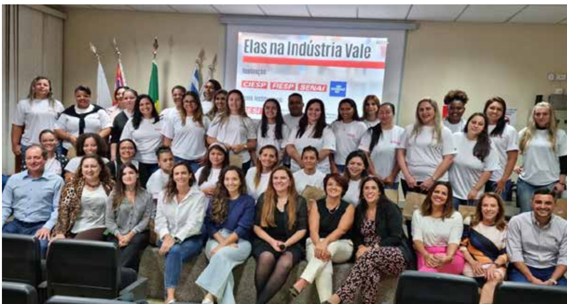
Turma Ela nas Indústria Vale