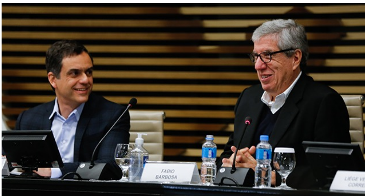
Encerramento da 2ª turma do Programa Elas na Indústria

A pesquisa está disponível no link https://www.fiesp.com.br/indices-pesquisas-e-publicacoes/pesquisa-rumos-esg-na-industria-paulista/