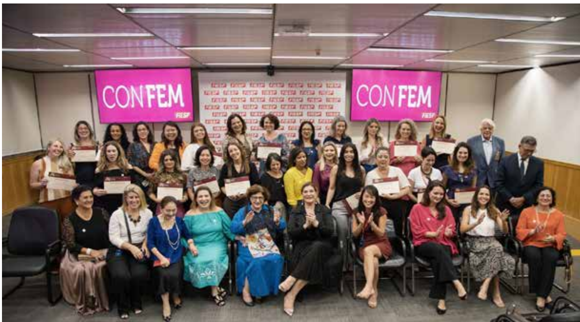
Encerramento da 2ª turma do Programa Elas na Indústria